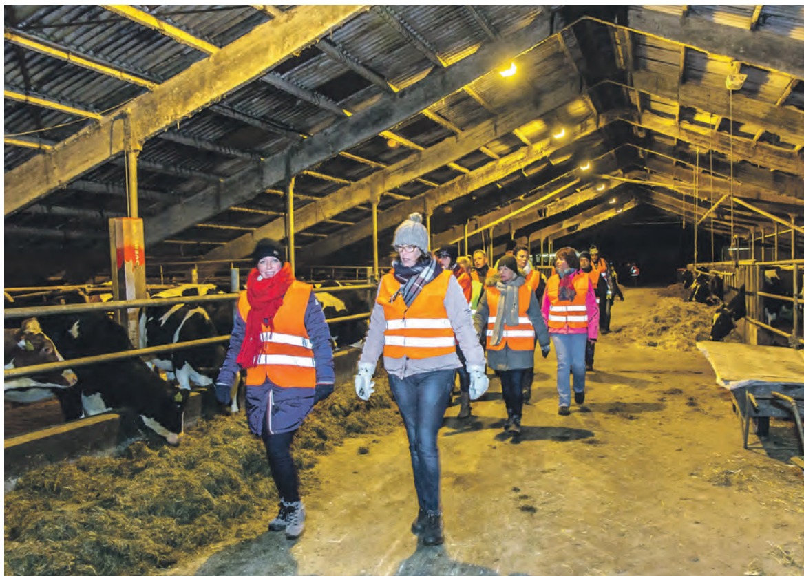
De kuierders rûnen dwers troch de pleats fan Van Mourik.