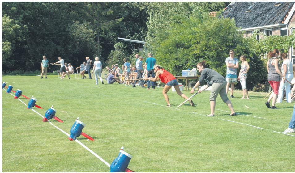
Sûnt de jierren santich binne ek froulju lid fan Reitsje Him.

Jorwert – Foaral gesellichheid, dêr giet it om by de tipferiening Reitsje Him' yn Jorwert. De feriening bestiet fyftich jier. Ofrûne snein wie de jubileumwedstriid op it sportfjild yn Jorwert. De dielnimmers makken der in gesellige dei fan mei kofje en oranjekeoke, in lunch en de jûns in barbecue mei in stikje muzyk. Tusken troch waard der in pear oerkes tipt. „Gesellich mei-inoar dwaande wêze. Even nearne mear oan tinke. Dêr giet it om.”