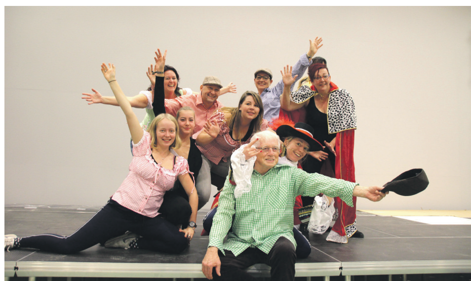
De spilers fan it Winsumer Sinteklazemearke op it toaniel